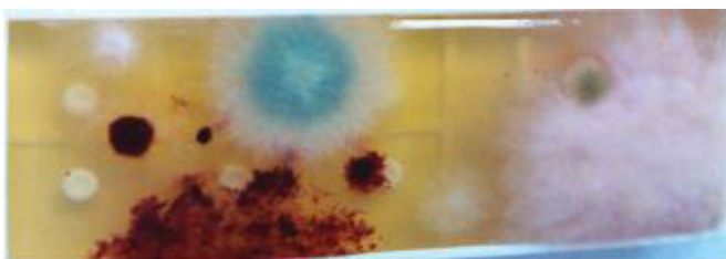
Bakterie a plísně při běžné dezinfekci

Dezinfekce a čištění pomocí prostředků na bázi PHMG (polyhexametylenguanidinu) mají za sebou velké množství aplikací po celém světě a každé jejich profesionální použití s sebou přináší i plnohodnotný mikrobiologický monitoring. Každý profesionální partner má možnost využít moderní medicínské metody sledování bakterií, plísní, kvasinek a řas na rozličných površích, v ovzduší i v roztocích. Kromě toho může každý uživatel těchto produktů přímo na svém pracovišti uplatnit naprosto nezávislý monitoring kvality čištění a dezinfekce. Pokud i vy chcete mít v této oblasti spolehlivého partnera , chcete se soustředit na svoji hlavní činnost a neřešit problémy s hygienou, pak jsou bezchlórové produkty disiCLEAN a H2O COOL Vaše správná volba.